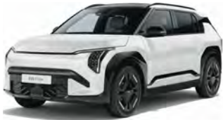
Bílá Clear (UD) Bez příplatku