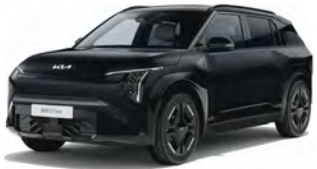
Perleťová černá Aurora (ABP)