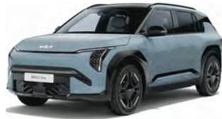
Modrá Frost (EBB) Pastelová