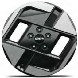
17" slitinový disk s pneumatikami 215/60 R17 - Air / Earth