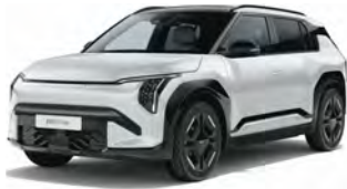
Perleťová bílá Snow (SWP)