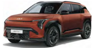
Terra Cotta (TCT)