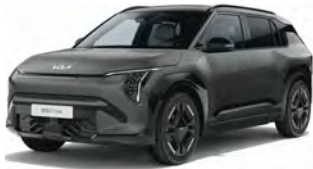
Šedá Shale (EBD)