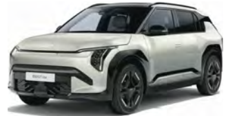
Stříbrná Ivory (ISG)