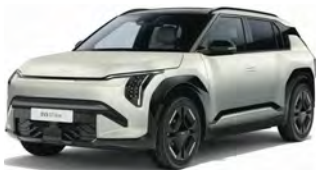
Stříbrná Ivory (ISM) Matná