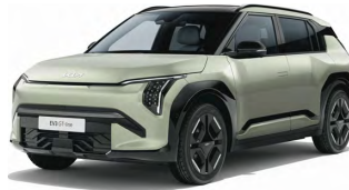
Zelená Aventurine (AG3)