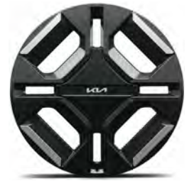
19" slitinový disk s pneumatikami 215/50 R19 - GT-Line